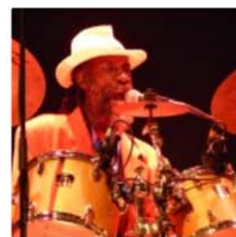
Leroy « Horsemouth » Wallace