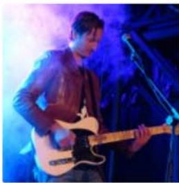
Mardjenal Syndicate