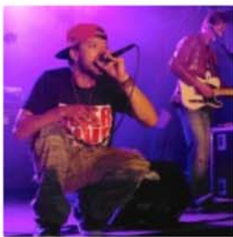
Mardjenal Syndicate © Anne Pastori