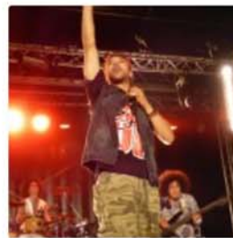
Mardjenal Syndicate