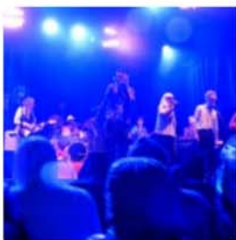
Et soudain la pluie...