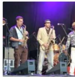
Rootstudy © Anne Pastori