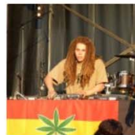
Gondwana © Anne Pastori