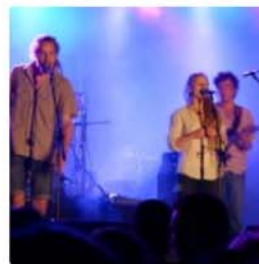
I-Twins © Anne Pastori