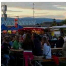
Plein-les-Watts Festival 2014