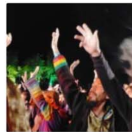
Le public durant le concert de Mardjenal Syndicate