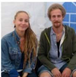
Les I-Twins